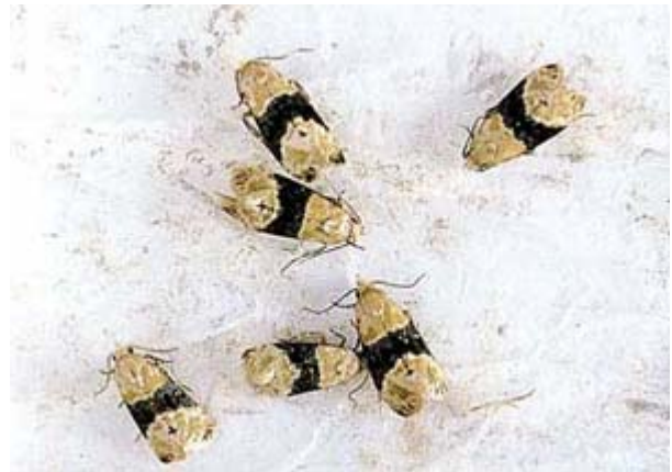
Traubenwickler-Männchen auf dem Leimpapier der Pheromonfalle.