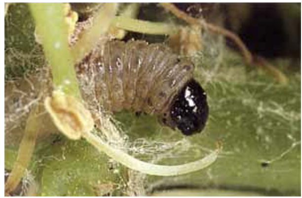
Heuwurm-Raupe beim Verlassen des Gespinstes.

Normalerweise findet wegen der hohen Toleranzgrenze keine Heuwurmbekämpfung statt. Der Sauerwurm muss dagegen in den meisten Lagen bekämpft werden. Es stehen mehrere Möglichkeiten zur Auswahl: Für grosse Reblagen ab 10 ha und isolierte Parzellen ab 1 ha Fläche steht die Verwirrungstechnik mit Pheromonverdampfern zur Verfügung. Wo beide Traubenwicklerarten vorkommen, kann die Kombikapsel eingesetzt werden. Die Verdampfer müssen beim Beginn des ersten Fluges aufgehängt werden. Als weitere Variante sind Bakterienpräparate ( Bacillus thuringiensis ) als selektive biologische Insektizide verfügbar. Behandlungstermin: 8-10 Tage nach dem Flugmaximum der 2. Generation. Zudem stehen relativ nützlingschonende Wachstumsregulatoren zur Verfügung. Weitere Insektizide aus der Gruppe der Phosphorsäureester und Carbamate sind ebenfalls bewilligt, sollten jedoch wegen ihres breiten Wirkungsspektrums und starker Toxizität für Nützlinge nur sehr restriktiv in starken Befallslagen eingesetzt werden.