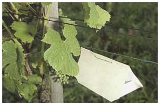
Pheromonfalle für die Kontrolle des Falterfluges.