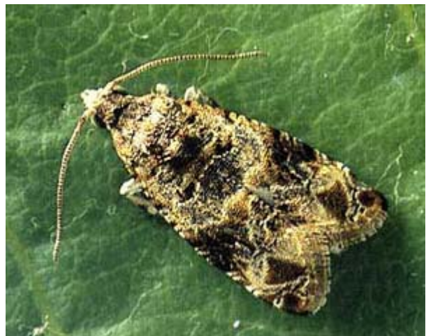
Falter des Bekreuzten Traubenwicklers, Lobesia botrana . Flügelspannweite 11 - 13 mm.

In zahlreichen Westschweizer Reblagen und zunehmend auch in der Ostschweiz kommt der Bekreuzte Traubenwickler allein oder zusammen mit dem Einbindigen vor. Die Befallsstärke variiert je nach Witterungsbedingungen von Jahr zu Jahr. Heisses und trockenes Wetter begünstigt den Bekreuzten Traubenwickler. Die Falter schlüpfen aus der Puppe, welche eingesponnen in einen Cocon unter losgelöster Borke überwintert haben. Der erste Flug setzt zwischen Mitte April und den ersten Maitagen ein. Die Falter sind dämmerungsaktiv. Die Flugdauer beträgt 3-5 Wochen. Nach der Paarung legen die Weibchen der ersten Generation 40-60 Eier auf die Blütenköppchen oder