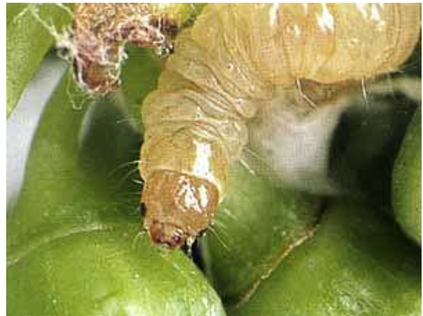
Heuwurm-Raupe mit ihrem Gespinst.