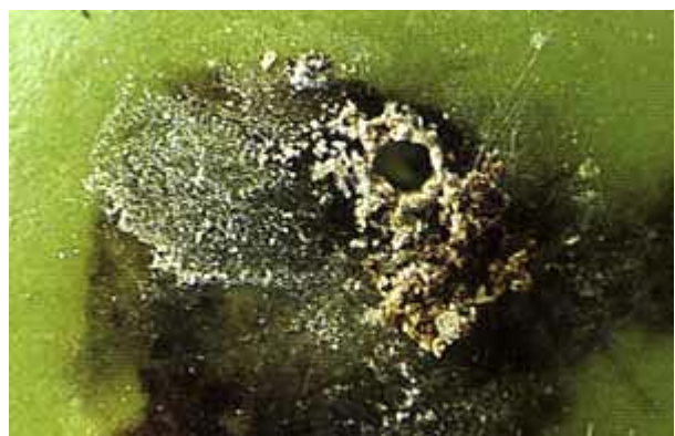
Detailansicht des Schadens zweiter Generation,