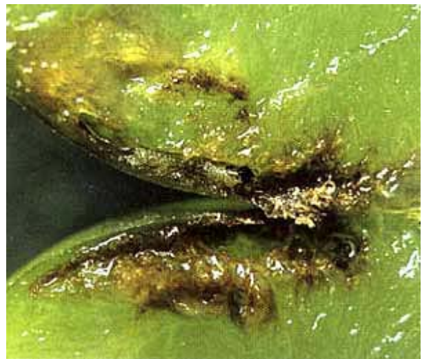
Schnitt durch eine von der zweiten Generation befallene Beere.