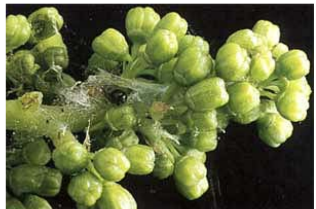
Geschein vor der Blüte mit Gespinnst und Heuwurm.