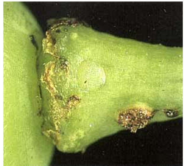
Eiablage der zweiten Generation auf Beerenstiel.