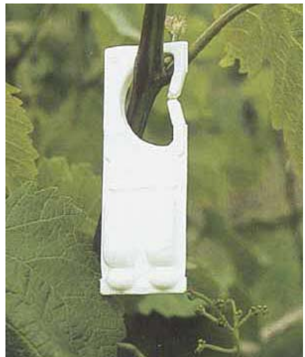
Verdampfer mit synthetischem Sexuallockstoff für die Verwirrungstechnik beim Einbindigen Traubenwickler.

Bearbeitet von Agroscope FAW Wädenswil und RAC Changins.