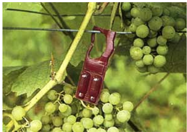
Verdampfer mit synthetischem Sexuallockstoff für die Verwirrungstechnik.

Normalerweise ist wegen der hohen Toleranzgrenze keine Heuwurmbekämpfung notwendig. Der Sauerwurm