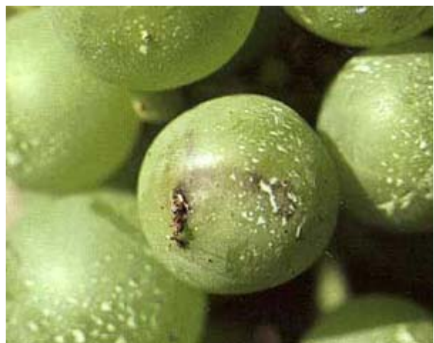
Schaden der zweiten Generation.