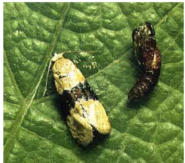
Falter des Einbindigen Traubenwicklers, Eupoecilia ambiguella . Flügelspannweite 12 - 15 mm.

In der Schweiz variiert die Befallsstärke je nach Witterungsbedingungen von Jahr zu Jahr. Feuchtes Wetter und geringe Temperaturunterschiede zwischen Tag und Nacht begünstigen hohe Populationen. Die Falter schlüpfen aus der Puppe, welche den Winter eingesponnen in einen Cocon unter losgelöster Borke verbracht haben. Der erste Flug setzt zwischen Mitte April und den ersten Maitagen ein (eher später als beim