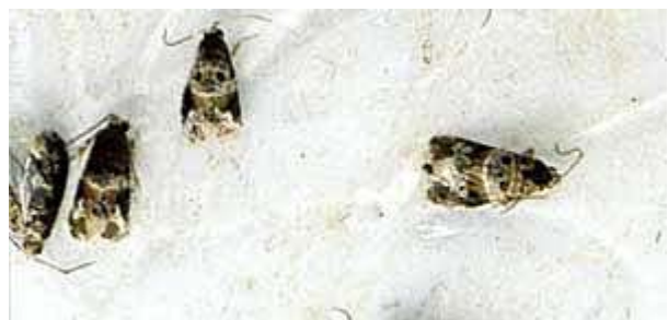
Traubenwickler-Männchen auf Leimpapier der Pheromonfalle.